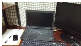
在宅土佐さんのデスク周り！