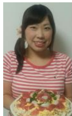
大好きな料理☆ マグロとホタテの ちらし寿司を 作りました！

A.最初は興味を持ってもらえなくてもしっかりと説明することで納得していい買い物をしたと思ってもらえることです。完売した時うれしいです。